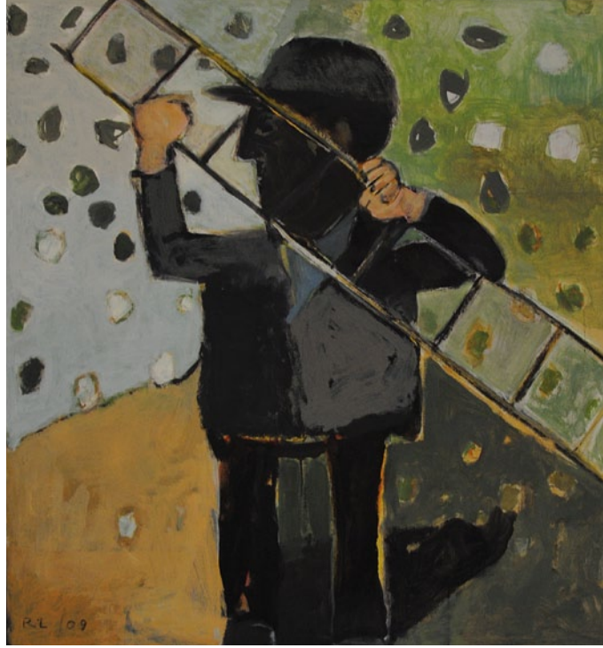
Titel: Paar, 2002, Acryl/Kohle auf Hartfaser, 117 x 55,5 cm Mann mit Hund, 2009, Acryl/Sand/Kohle auf Leinwand, 140 x 42 cm Zirkus, 2002, Öl/Acryl auf Leinwand, 100 x 80 cm Drei Köpfe, 1985, Öl auf Holz, 26 x 33 cm Birnen mit Flasche, 2013, Öl/Acryl/Kohle auf Hartfaser, 50 x 60 cm Mann mit Leiter, 2009, Acryl auf Leinwand, 130 x 120 cm