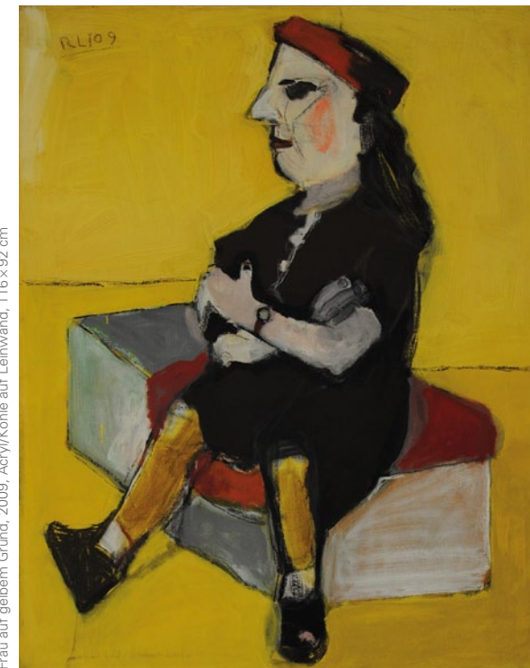
Frau auf gelbem Grund, 2009, Acryl/Kohle auf Leinwand, 116 x 92 cm