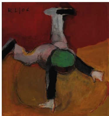
Tanz, 2006, Öl/Acryl/Kohle auf Leinwand, 49 x 44,5 cm

GALERIE DER MODERNE HINDENBURGDAMM 57 C 12203 BERLIN-LICHTERFELDE