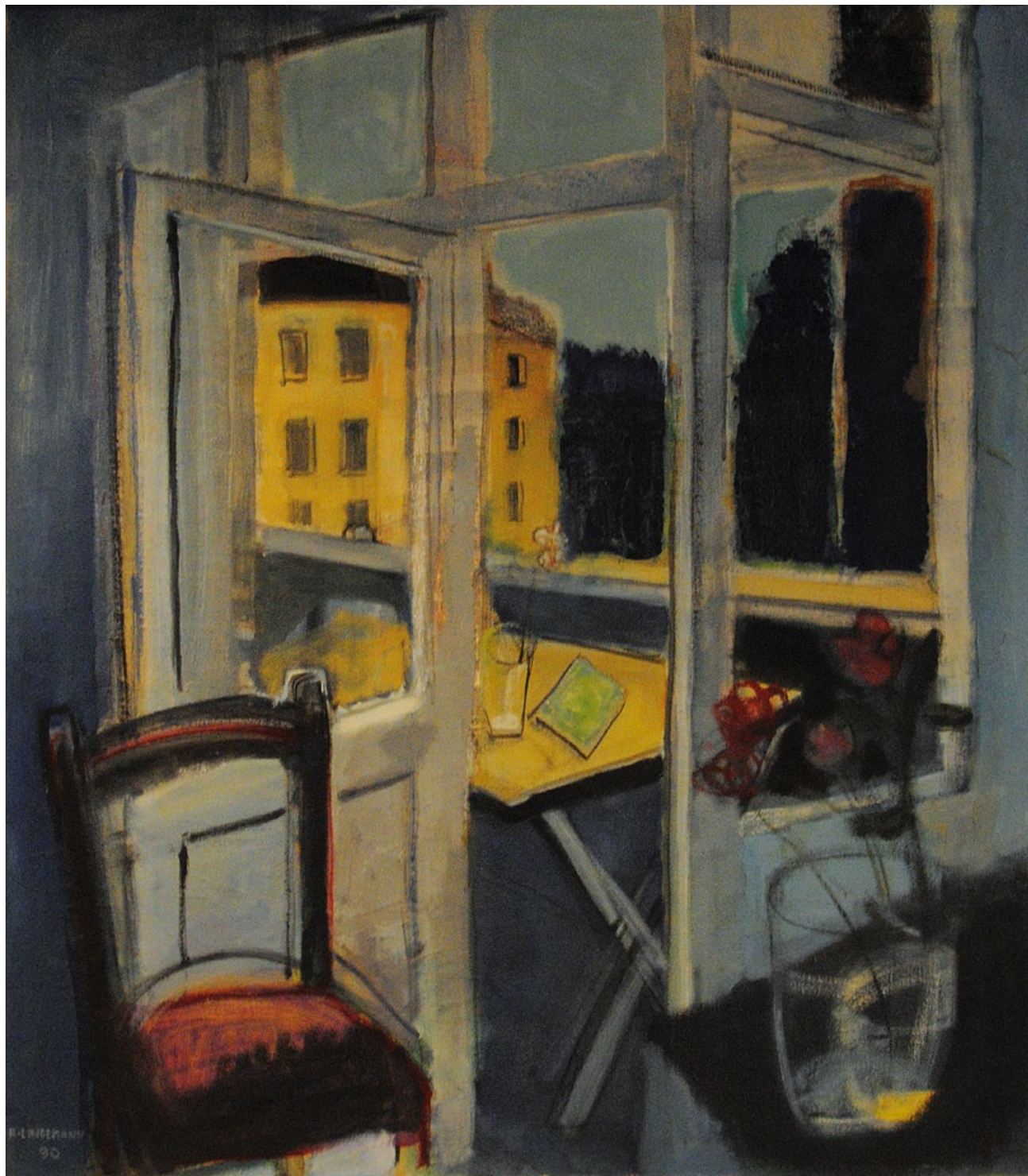
Balkon, 1990, Acryl/Kohle auf Leinwand, 99 x 88 cm

VOM 10. NOVEMBER '17 BIS 31. JANUAR '18 GEÖFFNET DI–DO 14–19 UHR, FR–SA 10–14 UHR